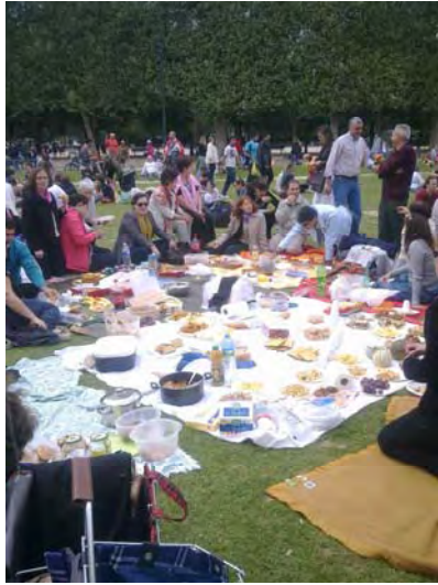
un pique-nique bien mérité