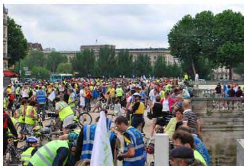
le point de ralliement sur l'esplanade du Louvre