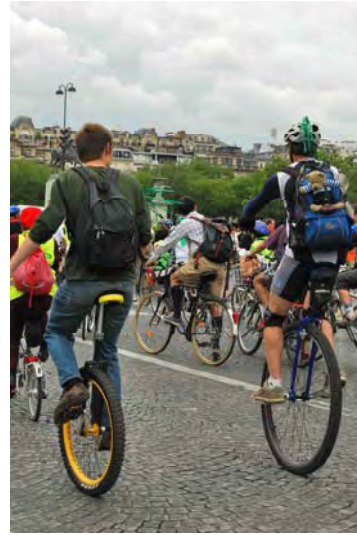
de la fantaisie