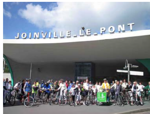
un départ en famille et entre amis