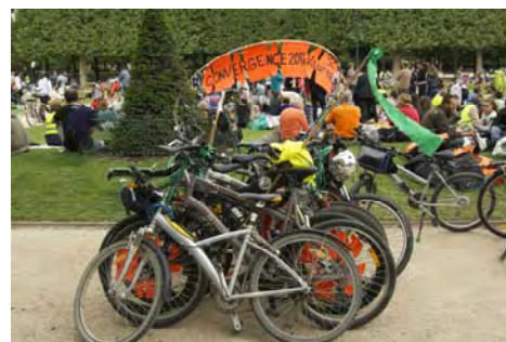
les cyclistes sur la pelouse, les vélos au repos