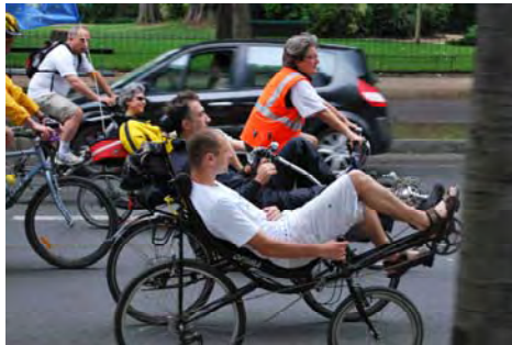
un défilé de vélos de tous genres