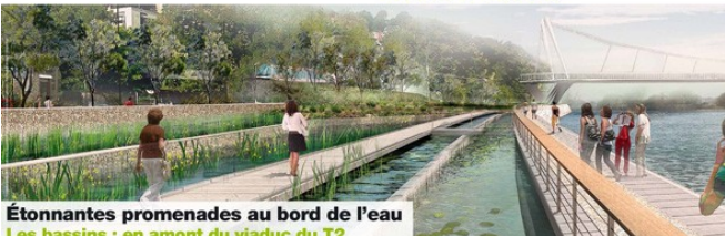
Étonnantes promenades au bord de l'eau Les bassins : en amont du viaduc du T2

Maquette des bords de Seine au niveau de la rue Troyon à Sèvres. Des bassins et du béton